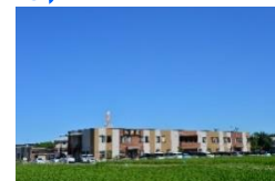
第32号 令和 7年1月発行