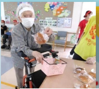
スーパー和光園で夕食の野菜をお買い物