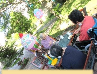
外は気持ちいいですね