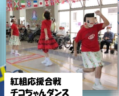
紅組応援合戦 千コちゃんダンス