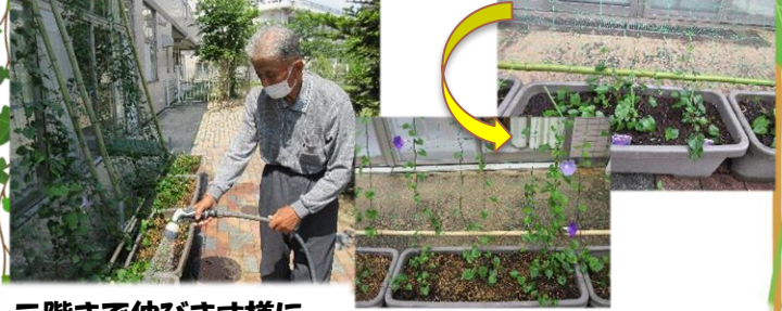
二階まで伸びます様に… 蔓草の伸び着く先に盛夏かな

和光園の初夏の風物詩・グリーンカーテン作りが今年も行われました。連日の水やりの成果が、さっそく朝顔のつるが天に向かって成長をはじめていいます。猛暑が予想される近夏ではありますが、このグリーンカーテンが一服の清涼剤となってくれますように。