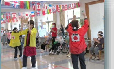
白組応援合戦 東京五輪音頭