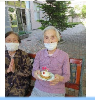
ケーキは大好きだそうです

入所では、同じテーブルで食事やお話をされる顔馴染みの方々も誕生日を祝いたいというリクエストがあり、誕生日を中庭で開催したのでご紹介いたします。天気にも恵まれ、気心知れた方々と外でゆつくりと流れる時間の中、ケーキを食べ、雑談や歌って過ごしました。