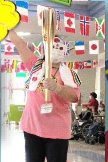
和光園通所にも聖火が到着!