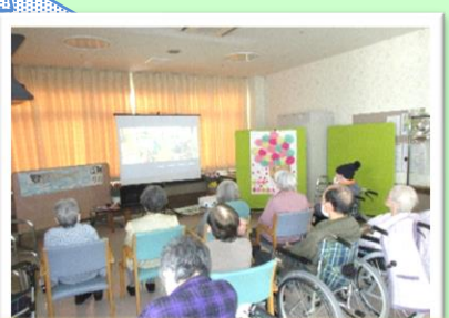
オート三輪の登場と爆走に歓声が