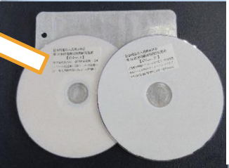
DVD 2枚で多くの学びを行うことが出来ました。

六月一五・一八日に、オンラインにて「施設責任者・教室主催者の会」が開催されました。ミッション(使命・存在意義)・ビジョン(目指すべき方向性)・バリュー(行動指針)を学ぶことで一人でも多くの笑顔を増やせるような自立支援・人づくり・地域づくりについて学びました。