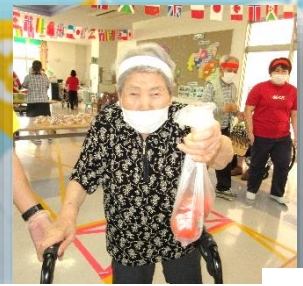
若妻会から朝とれ野菜の入荷で～す