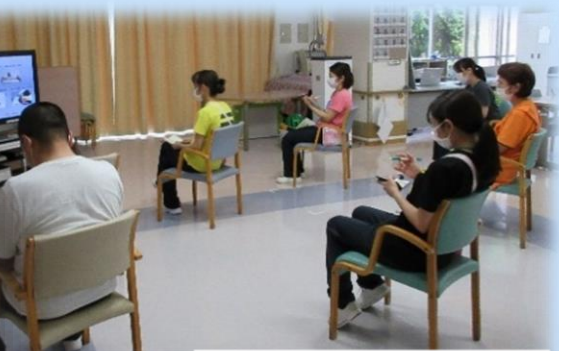
事例を通して、自立支援について学びました

社会福祉法人道海永寿会 第16回学習療法実践研究発表 【Disc. 2】 小規模多機能ケアホームみつまた・特別養護老人ホーム永寿園・デイサービス・デイケア・大川市成果運動型認知症事業・総所長総括