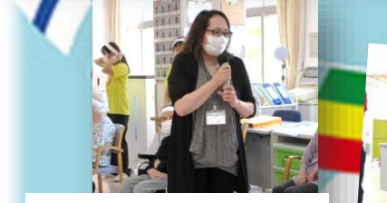
事務長からエールの一言