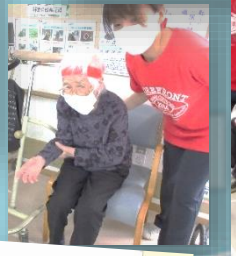
ポッチャで オリンピック気分♪