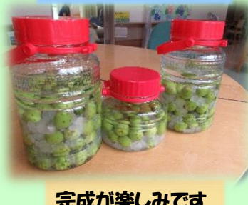
完成が楽しみです