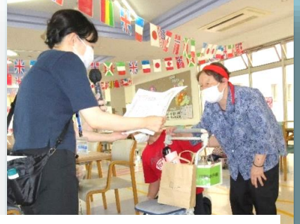
和楽苑施設長より表彰状授与