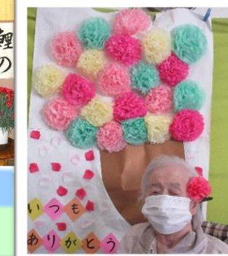
大きなカーネーションに笑顔がでます(#.#)

五月九日に母の日イベントを開催しました。職員手作りの大きなカーネーションと鯉のぼりです。職員が飾り、プロジェクターで「オールウェイズ三丁目の夕日」を上映しました。手作りのおもてなしに利用者様も喜んで頂き、映画でも懐かしの昭和の街並み、ゴジラなども登場し、昔を思い出しながら楽しんで頂きました。