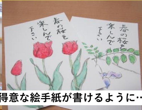
得意な絵手紙が書けるように…