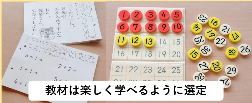
教材は楽しく学べるように選定

学習療法とは、音読と計算を中心とする教材を用いた学習を、学習者と支援者がコミュニケーションをとりながら行うことにより、学習者の認知機能やコミュニケーション機能、身辺自立機能などの前頭前野機能の維持・改善を図るもの(非薬物療法)