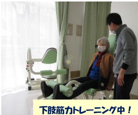
下肢筋カトレーニング中!