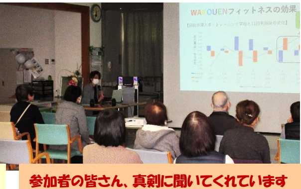
参加者の皆さん、真剣に聞いてくれています