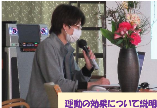
運動の効果について説明中