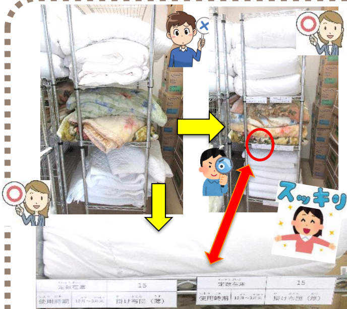
一目で寝具の定数を把握できるようになりました

入所では、リネン庫の5Sを実施しました。5S前には、毛布、布団、敷きパットなどが、乱雑な扱いになっていましたが、5Sを実施したことで、畳み方の統一、定位置、在庫数を決め、スッキリしました。月に二回、在庫チェックを業者様と取り決め、欠品、過剰在庫とならないように調整していきます。