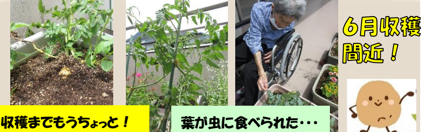
収穫までもうちょっと! 葉が虫に食べられた...