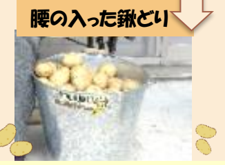
ほくほくのじゃがいもの収穫