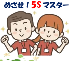
めざせ! 5S マスター