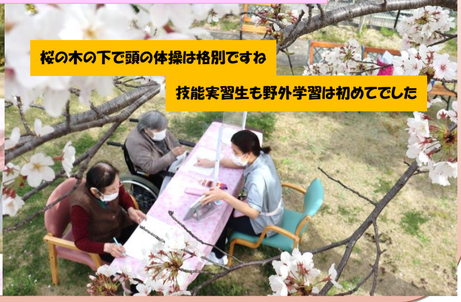
技能実習生も野外学習は初めてでした