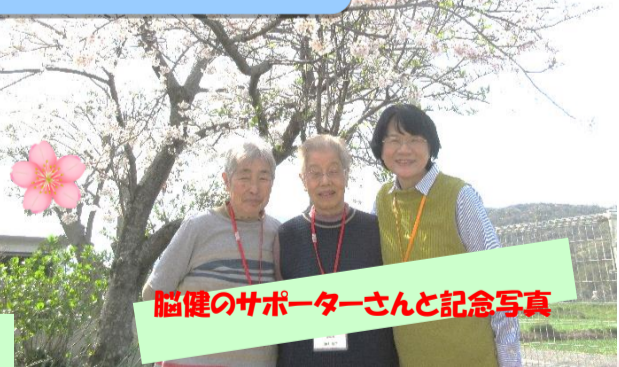
脳健のサポーターさんと記念写真