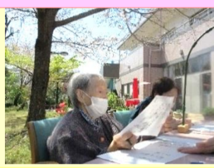
中庭に響く春の声