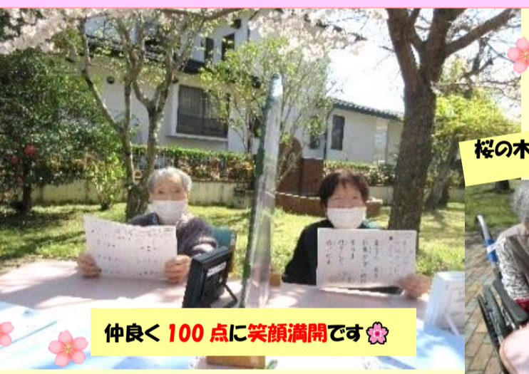
仲良く 100 点に笑顔満開です