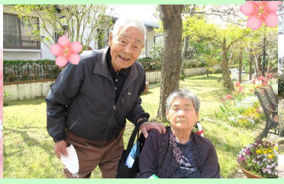
ご主人は脳健で奥様は通所リハビリで学習療法