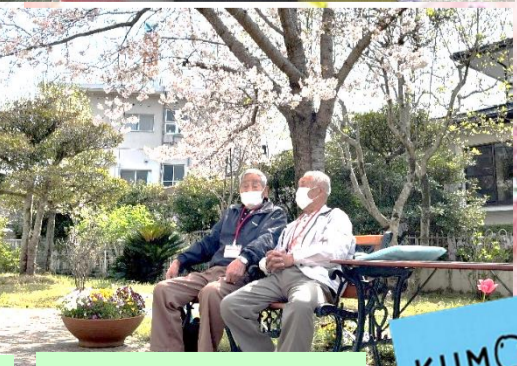
同級生は永遠の若大将

学習後の貯筋エクササイズでは和光園中庭で、理学療法士指導の下、正しいウォーキングの方法を学び、実際に歩いてみました。おしゃべりをしながら、桜吹雪の舞い散る中のウォーキングで心地よい汗を流しました。