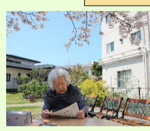
笑顔 100 点満点