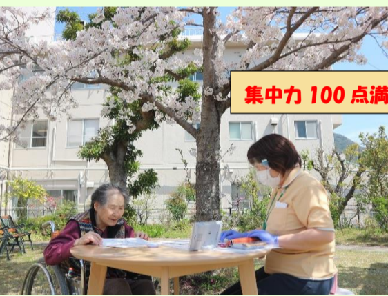
集中力 100 点満点