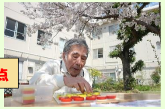
桜で一句も 100 点満点