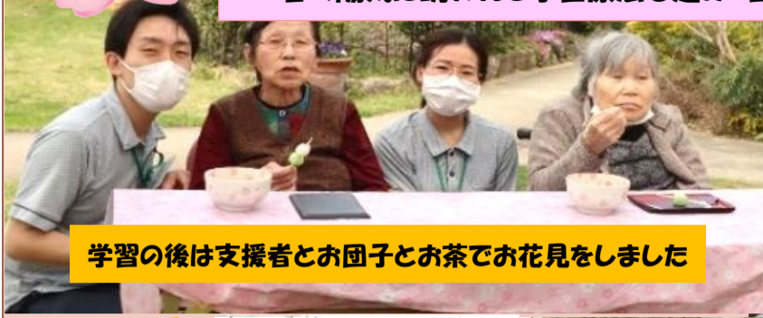
学習の後は支援者とお団子とお茶でお花見をしました