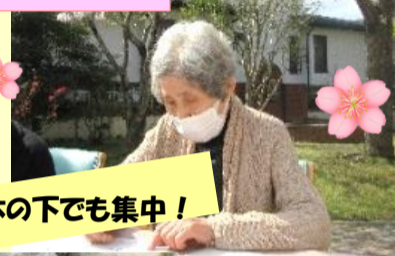
桜の木の下でも集中！