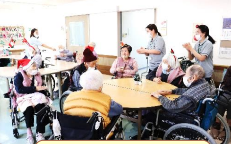
皆で歌の大合唱です