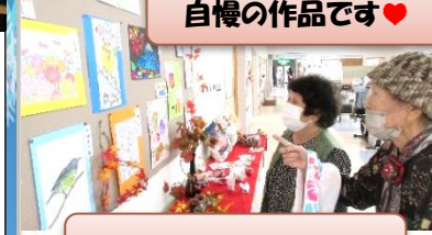
力作揃いの作品展

十月三十一日から十一月六日の一週間にかけて文化祭を開催しました。ご利用者様の作品の展示、二日・四日・五日にはのど自慢大会を開催。展示では俳句や絵手紙等の力作で皆様に楽しんでいただきました。のど自慢大会では参加者の歌声に拍手喝采で盛り上がりました。