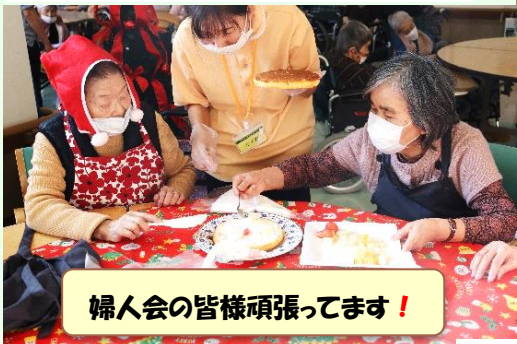
婦人会の皆様頑張ってます！

十二月二十五日にクリスマス会を開催しました。全員で「きよしこの夜」「赤鼻のトナカイ」を歌い、その後ケーキ作りを行いました。サンタクロースに仮装した職員と利用者様で記念撮影を行いました。みんな笑顔いっぱい楽しい時間となりました。