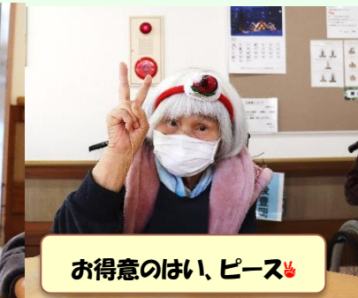
お得意のはい、ピース