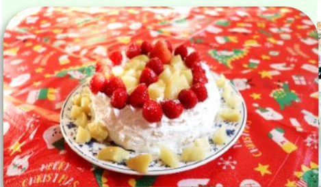
美味しそうなケーキが出来ました☆