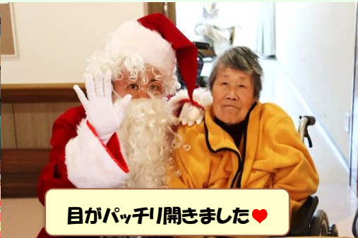
目がパッチリ開きました