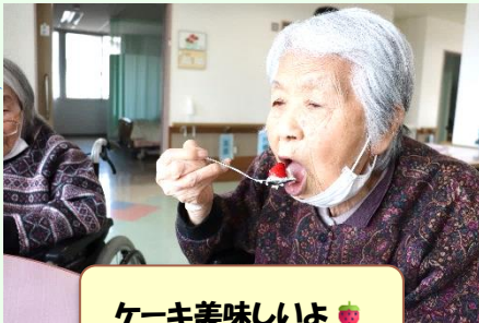
ケーキ美味しいよ