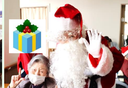
サンタさんと一緒にパチリ