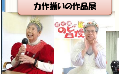
皆さん衣装もパッチリ