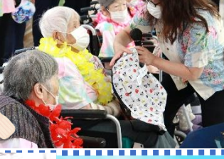
皆さんにプレゼント★