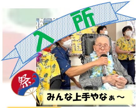
職員全員で みんな上手やなあ～