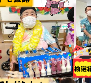
皆さんにプレゼント★