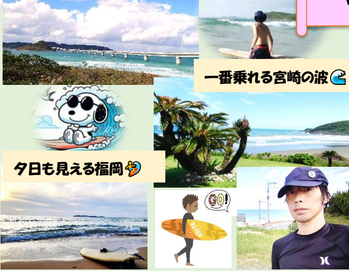
一番乗れる宮崎の波