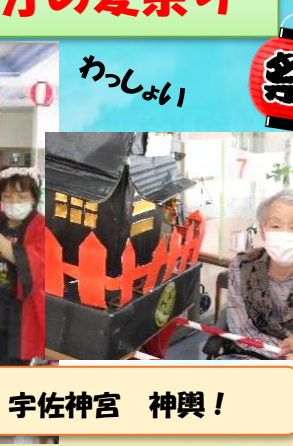
「学習療法で今を笑顔で生きる」