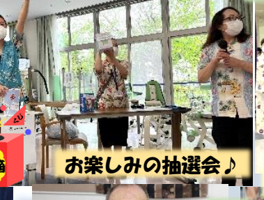
素敵な時計が 当たりました!