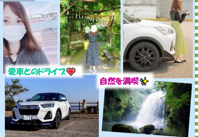
愛車とのドライブ