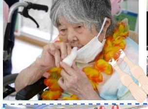
「どうにもとまらない」を披露