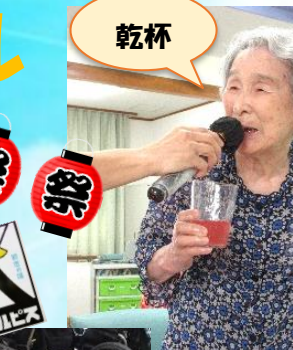
夏はやっぱりカルピス♪