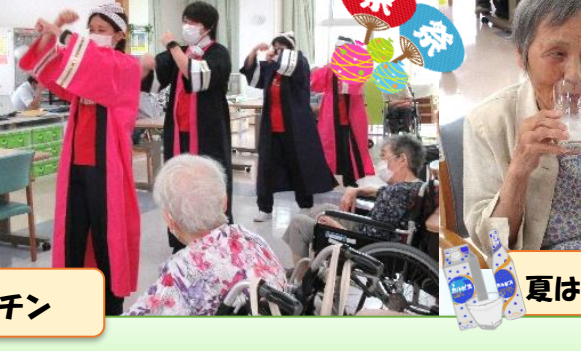
よっちょくれ、見ちょくれ、大分の夏祭り