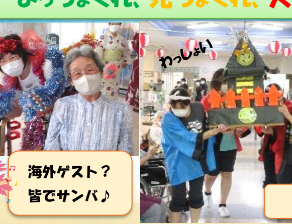
「学習療法で今を笑顔で生きる」