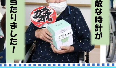
素敵な時計が 当たりました!