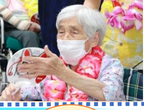
お楽しみの抽選会♪