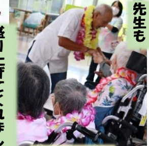
利用者様も 輪に入り踊りました