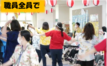
「どうにもとまらない」を披露

八月九日(金)に恒例である納涼祭を和光園通所ホールにて開催しました。昨年と同様に入所利用者様と職員のみ参加とはなりません。今年開催されましたパリオリピックの盛り上がりにも負けない様に、職員、利用者様が一緒にマッカセの盆踊りを踊り、大分県夏の風物詩でもある府内戦紙を披露したり、職員全員では山本リンダの「どうにもとまらない」を踊ったりと笑いが絶えない納涼祭となりました。 また、会の終盤では抽選会をおこない、番号が読み上げられる度に真剣に番号を確認されている姿が見られ、大きな歓声が上がり、とても盛り上がりのある抽選会となりました。