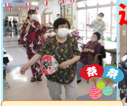
マッカセ踊りはまかせて