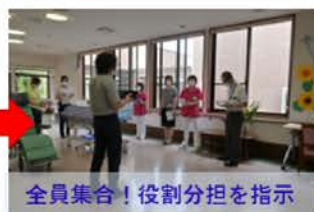
全員集合！役割分担を指示