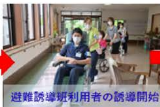
避難誘導班利用者の誘導開始