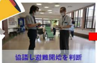
協議し避難開始を判断