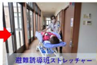
避難誘導班ストレッチャー