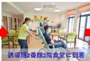
誘導班2番館2階食堂に到着