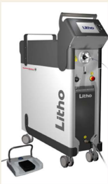
Quanta Litho レーザー

麻酔方法は、全身麻酔もしくは腰椎麻酔です。碎石して細くなった結石は、カテーテルを用いて体外へ取り出します。最後に尿管ステントを留置します（膀胱の結石の場合は、尿管ステントは留置しません）おなかを切らない内視鏡手術なので、患者さんへの体への負担が少なく、入院期間は3～4日間程度です。