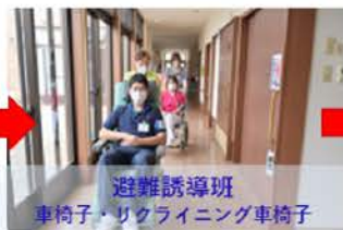
避難誘導班 車椅子・リクライニング車椅子