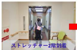
ストレッチャー2階到着