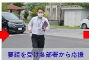
要請を受け各部署から応援