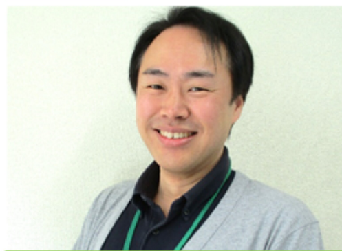
大分県認知症介護指導者

国の指標では、2025年には5人に1人が認知症になるとされており、他人ごとではない身近な病気の1つとなりました。物忘れと認知症の違いを理解し、日々の生活を工夫することで認知症になるリスクを軽減することが可能です。