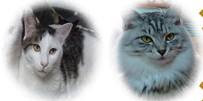
みかん (画面左←)、ソックス (画面右→) 飼い主募集中です!