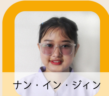
ナン・イン・ジン

日本に来たときは色んな 失敗をしましたが、だん だん生活に慣れてきて楽 しいです。